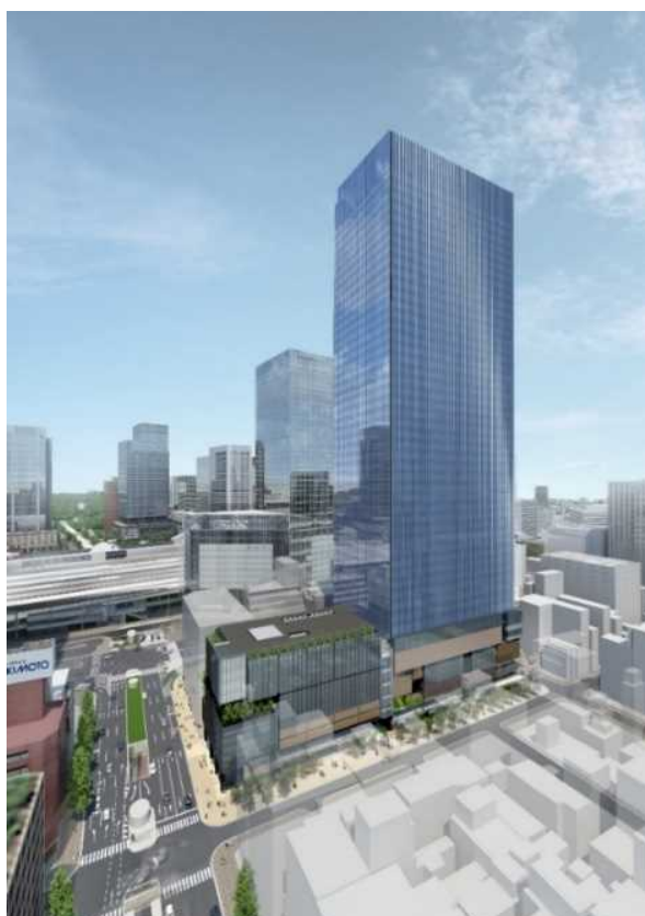
本事業の外観イメージ ※中央通り方面から望む

今般の合意により、オフィスワーカーをはじめとした一人ひとりのウェルビーイングに資する取組みなど本事業および本医療施設の付加価値を高める施策や災害時における医療連携などを通じて、デジタル化やコロナ禍などに伴う社会変容を見据えた社会全体への価値提供や、社会に貢献する施策について連携・協力を図っていく予定です。日本医科大学と東京建物、大林組はこれからも人々の心豊かな暮らしと社会課題の解決、そして地球全体の健康に貢献してまいります。